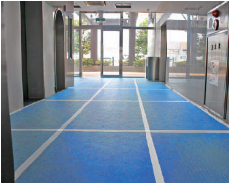
養生シート設置例