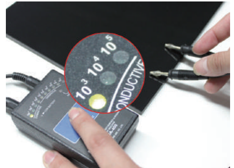
カイロンの抵抗値は実測平均 10^3\Omega